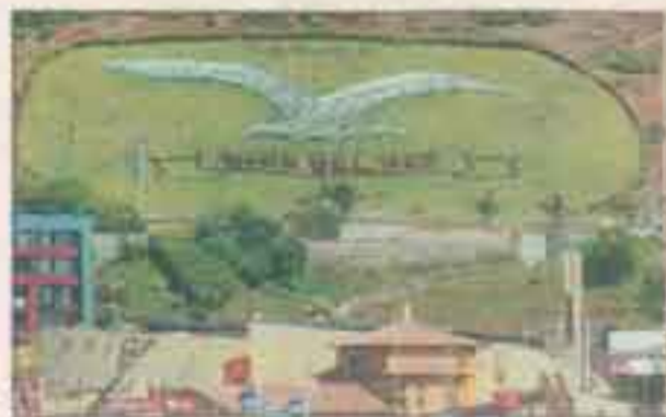
57 hectáreas cerca del Fundo Naval Las Salinas.