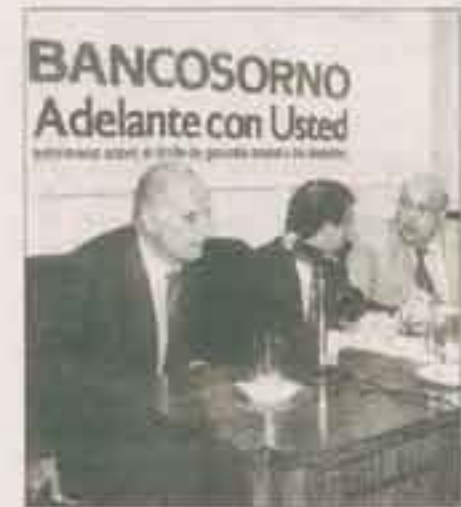
Junta de accionistas del Banco Osorno.

Dos años después de comprar el Osorno, "las Mezquitas" adquirieron el Banco del Trabajo y los fusionaron, transformándose en el tercer banco de