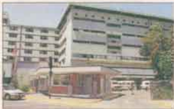
El tradicional Hospital Militar.

El grupo de empresarios de origen árabe, que en 1986 compró el Banco Osorno, amplía su cartera de inversiones hacia los sectores financiero, construcción, agrícola, acuícola, industrial, comercial y retail. Y de paso comenzaron a planear y materializar el recambio generacional. B 4