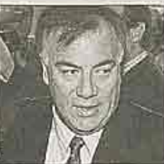
Ministro Osvaldo Andrade.

Una remodelación a las oficinas del séptimo piso de su edificio está efectuando el Ministerio del Trabajo, por un costo total de $41 millones. En esa planta están las instalaciones del departamento de Comunicaciones y algunas oficinas del Sence. De acuerdo con las bases de licitación, publicadas en el portal Chilecompra, se desmontarán los actuales tabiques de separación, se reemplazará la alfombra de todo el piso y se agregarán puertas de placarol, con bastidores de rauli. Los elementos de quincallería y pinturas ya aparecen especificados con marcas predeterminadas. El concurso fue adjudicado, a fines de marzo, a la Constructora Sisto Ltda.